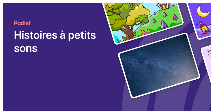
A la découverte de la grande musique ! (Padlet)

Vous découvrirez aussi un padlet dédié à la découverte de grandes œuvres du répertoire musical pour les élèves de cycle 1, 2 et 3 : venez écouter, explorer et relever un défi musical autour d'extraits du Carnaval des Animaux de C. St Saëns, de Pierre et le loup de S. Prokofiev, de Peer GYNT de E. Grieg. N'hésitez pas à consulter le site régulièrement !