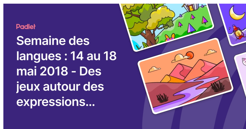
Semaine des langues : 14 au 18 mai 2018 - Des jeux autour des expressions idiomatiques (Padlet)

Ci-dessous un padlet recensant un ensemble de jeux :