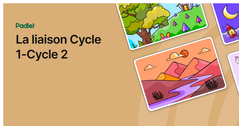
Liaison école maternelle/école élémentaire (Padlet)

Un padlet réunit l'ensemble des documents et s'organise en colonnes :