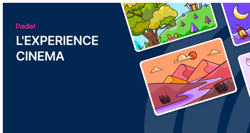
L'EXPERIENCE CINEMA (Padlet) Les ressources générales du dispositif scolaire École et Cinéma 79

Les ressources autour du film du 1er trimestre Capitaines !