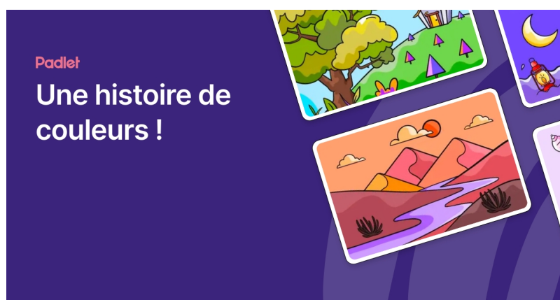
Une histoire de couleurs ! (Padlet) Fait avec Padlet