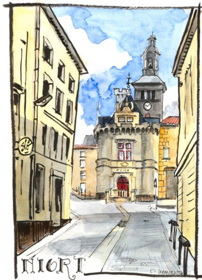
croquis aquarelle du Pilori, ancien Hotel de ville de Niort - ©I.Frances

Ce parcours permet aux élèves de découvrir des formes visuelles de productions artistiques , de travailler avec celles-ci pour entamer une démarche de création spécifique , de rencontrer des acteurs et des artistes des arts visuels , en prenant appui sur la programmation des expositions d'arts visuels de la ville de Niort.