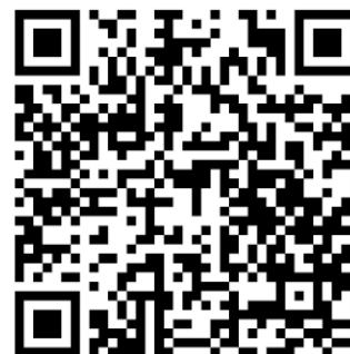
Poppy 79 - Melle / Marais / St-Maixent