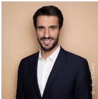
TONY ESTANQUET, Président du Comité d'Organisation des Jeux Olympiques et Paralympiques Paris 2024

L'année dernière, grâce à l'engagement de plus de 5 000 écoles et établissements, nous avons tous ensemble décroché la lune.