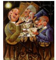
Otto Dix, Les joueurs de Skat

Les oeuvres d'Otto Dix sont des oeuvres de référence indissociables de la Grande Guerre. Elles sont une satire de cette période, notamment de la manière dont ont été traités les combattants à cette époque.