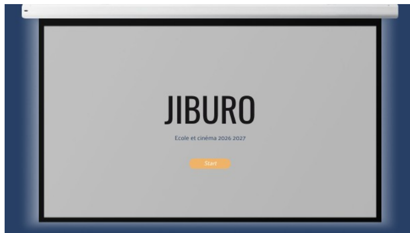
jIBURO | Genially (Genially)