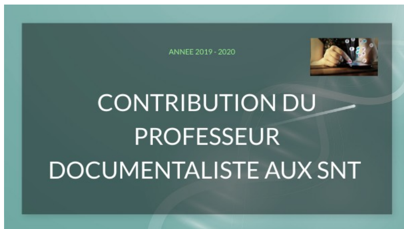
contribution aux SNT by cdi.c-thenezay on Genial.ly ( Genially ) contribution aux SNT by cdi.c-thenezay on Genial.ly