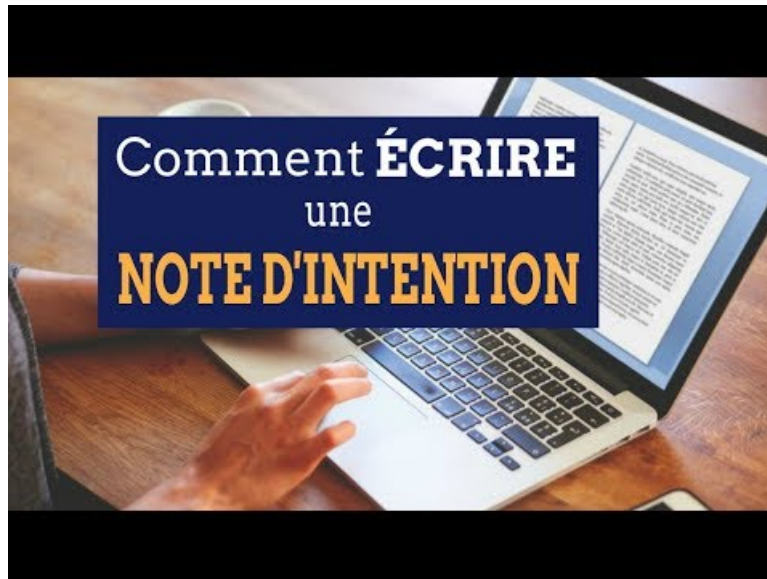
Comment ECRIRE une NOTE d'INTENTION (Video Youtube)