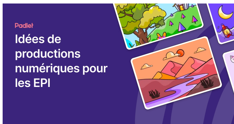
Idées de productions numériques pour les EPI (Padlet)

Et des idées de productions pour les EPI :