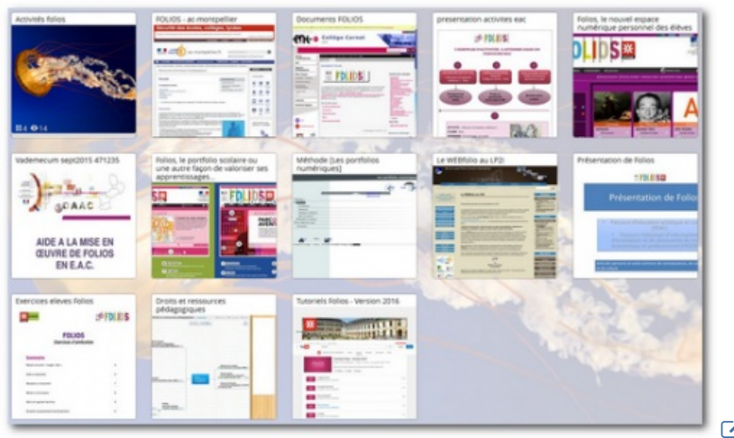
Cliquer sur l'image pour accéder à la sélection de sites.

(1) le profil présenté ici est un profil test