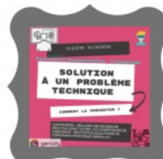
recherche 6 : exposé