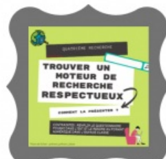
recherche 4 : moteurs