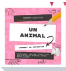
recherche 3 : exposé