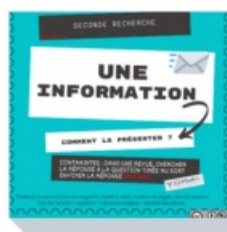
recherche 2 : information