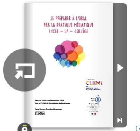
Académie de Bordeaux