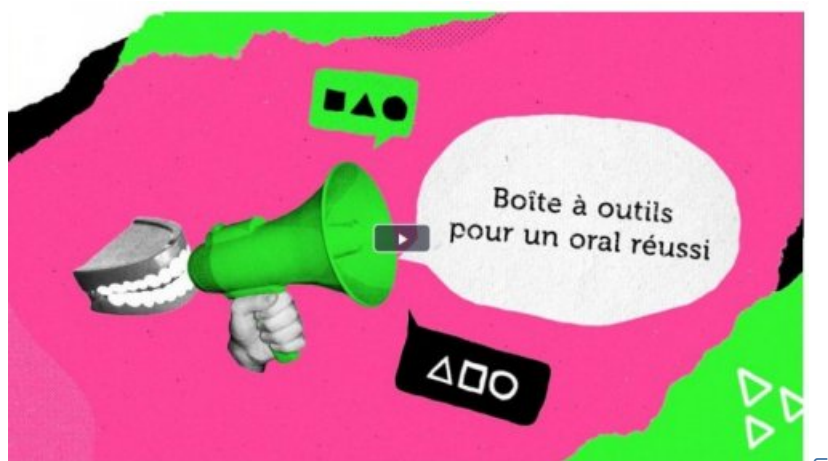
Académie de Besançon

Et un article "tout neuf" sur une forme de débat qui ne peut pas rater :