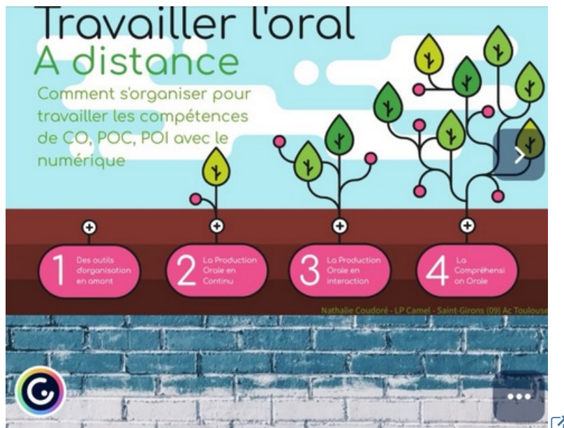
Académie de Toulouse