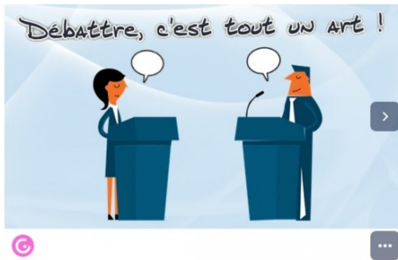
Plein écran Débat - Méthode (OK) by nalletprof17 on Genially