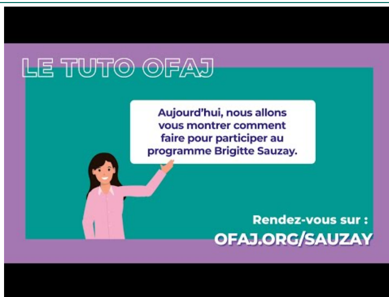
Tuto OFAJ : Comment participer au programme Brigitte Sauzay ? Les étapes clés (Video Youtube)