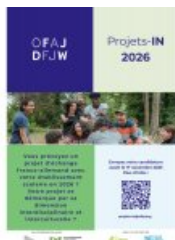
Affiche Projets-IN (PDF de 443.1 ko)

Le Goethe Institut Paris et l'Institut français Allemagne contribuent chaque année à la valorisation de ce programme en proposant le « Prix des Projets-IN » aux deux établissements scolaires qui ont réalisé le meilleur projet au cours de l'année scolaire précédente. Ce prix promeut particulièrement la pédagogie de projet à caractère interdisciplinaire et interculturel dans le cadre des échanges scolaires franco-allemands.