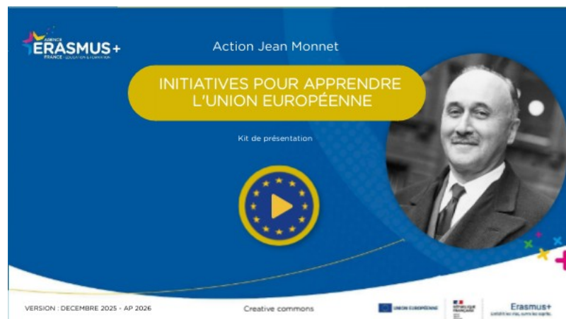
JM- Initiatives - 2025 (Genially)

Les actions Jean Monnet représentent un outil très efficace de diplomatie publique de l'UE.