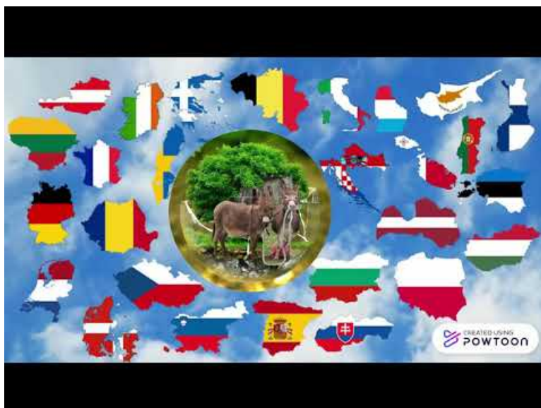
Comment ça marche ? (Video Youtube)