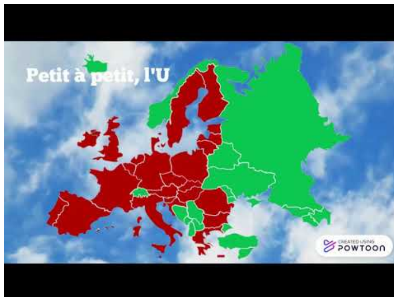
L'UE, qu'est-ce que c'est ? (Video Youtube)

▶ Tout savoir sur les 27 pays de l'Union Européenne