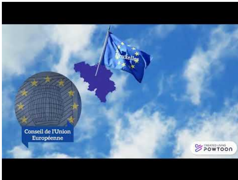
Les institutions européennes (Video Youtube)