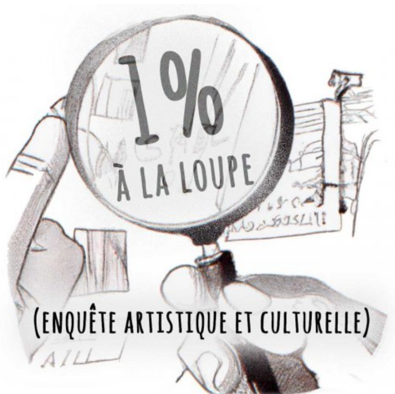
Visuel dispositif 1% à la loupe

Le dispositif "1% artistique à la loupe" propose d'utiliser les œuvres du « 1% artistique » comme supports pédagogiques. Ce dispositif s'articule autour des trois piliers de l'Éducation Artistique et Culturelle (EAC) : rencontrer, pratiquer, connaître.