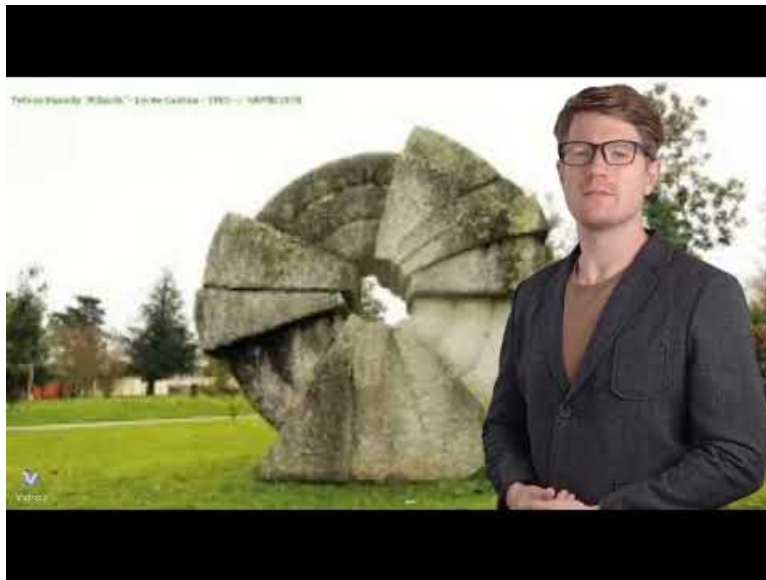
vidéo (Video Youtube) Présentation du dispositif "1% artistique à la loupe"