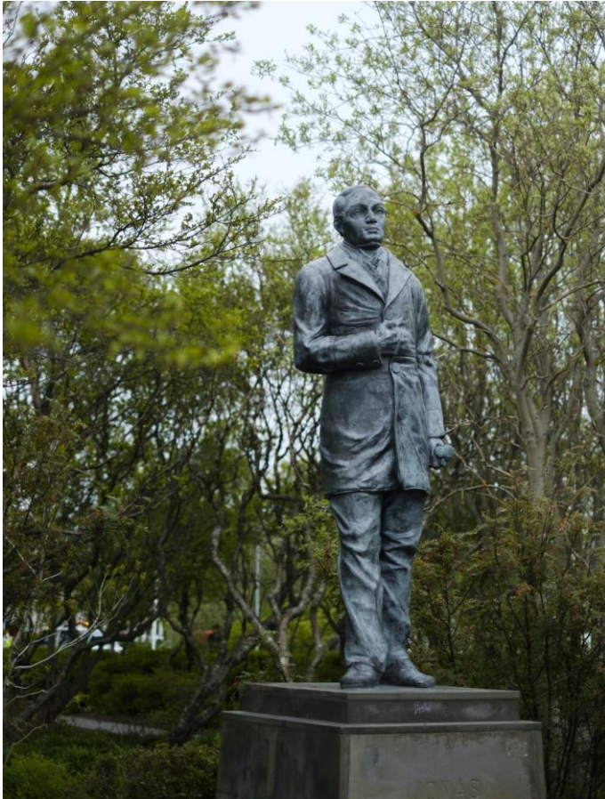
Sculpteur: Einar Jónsson

Jónas Hallgrímsson (né le 16 novembre 1807 à Hraun dans l'Öxnadalur, mort le 26 mai 1845 à Copenhague ) est un poète et naturaliste islandais . Il est célébré dans ce pays comme un héros national. plusieurs de ses poèmes, comme Heiðlóarkvæði , Ég bið að heilsa ou Álfareiðin ont été mis en musique et sont désormais considérés comme des chants traditionnels islandais. (Wikipédia).