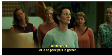
J'ai un secret et je ne peux plus le garder.