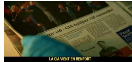
LA CIA VIENT EN RENFORT