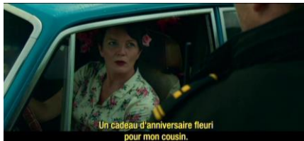
Un cadeau d'anniversaire fleuri pour mon cousin.