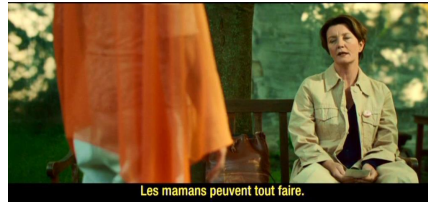
Les mamans peuvent tout faire.