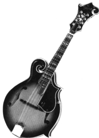
LA MANDOLINE AMERICAINE