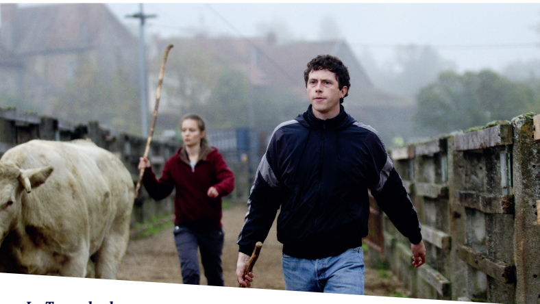
La Terre des hommes de Naël Marandin Fiction | 1h39

Constance est fille d'agriculteur. Avec son fiancé, elle veut reprendre l'exploitation de son père et la sauver de la faillite. Pour cela, il faut s'agrandir, investir et s'imposer face aux grands exploitants qui se partagent la terre et le pouvoir. Battante, Constance obtient le soutien de l'un d'eux. Influent et charismatique, il tient leur avenir entre ses mains. Mais quand il impose son désir au milieu des négociations, Constance doit faire face à cette nouvelle violence.