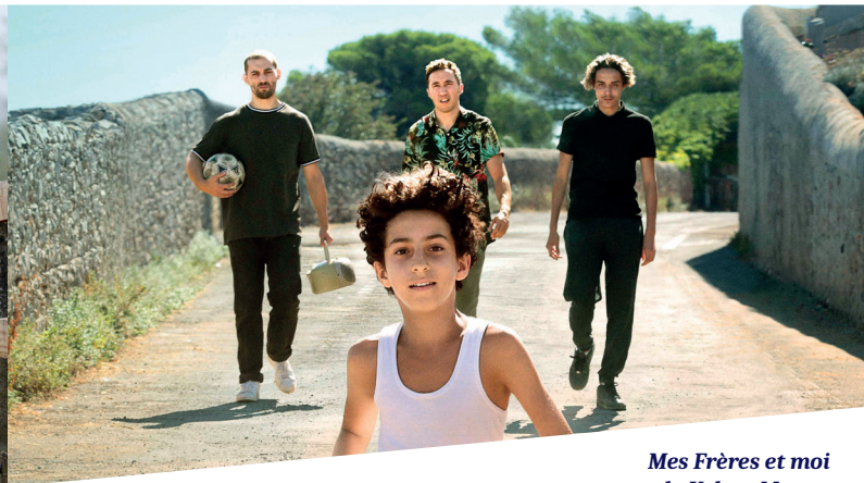
Mes Frères et moi de Yohan Manca Fiction | 1h48