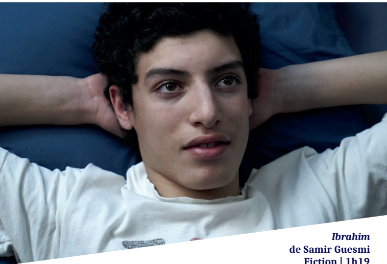
Ibrahim de Samir Guesmi Fiction | 1h19