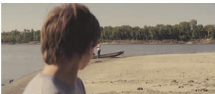
Plan 18 a