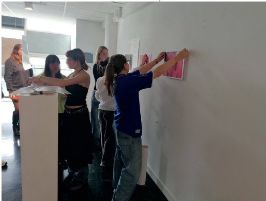
Travail de la scénographie en amont de l'exposition.