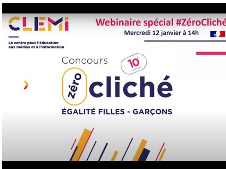
Webinaire de présentation du concours #ZéroCliché pour l'égalité filles-garçons 2022 – CLEMI (Video Youtube)

Le webinaire dédié à ce concours, a été organisé le mercredi 12 janvier 2022 :