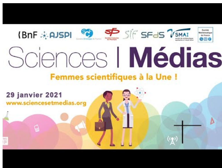
Femmes scientifiques à la une (Vidéo Youtube)

Retrouvez la liste des interventions dans le descriptif de la vidéo.