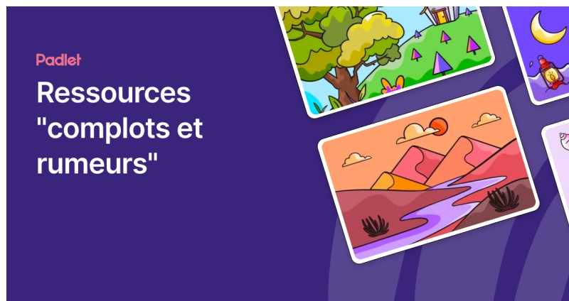
Ressources "complots et rumeurs" (Padlet)

Vous pouvez retrouver en fichier joint le diaporama de Guillaume Brossard ainsi qu'une sélection de ressources sur le padlet ci-dessous réalisé pour cette occasion :