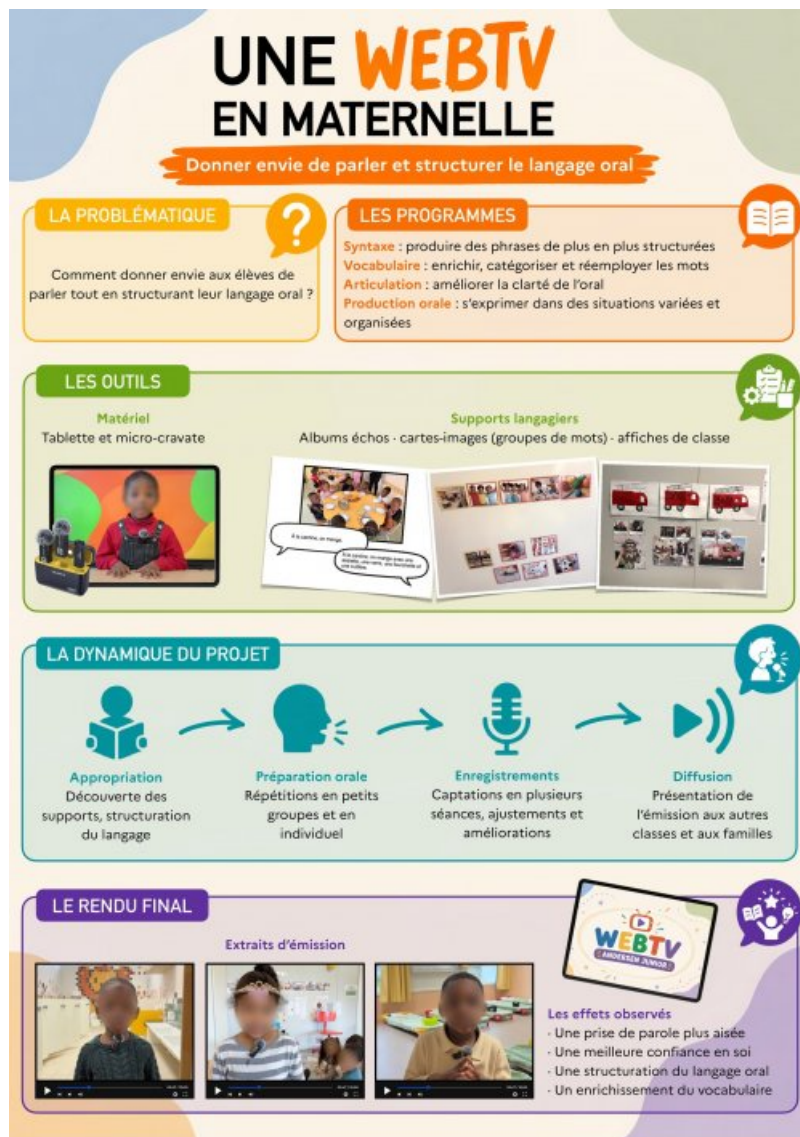
Une Web TV en maternelle