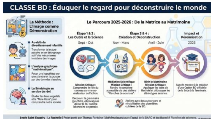
Classe BD : éduquer le regard pour déconstruire le monde

● Classe BD : éduquer le regard pour déconstruire le monde - Lycée Antoine de St Exupéry LA ROCHELLE