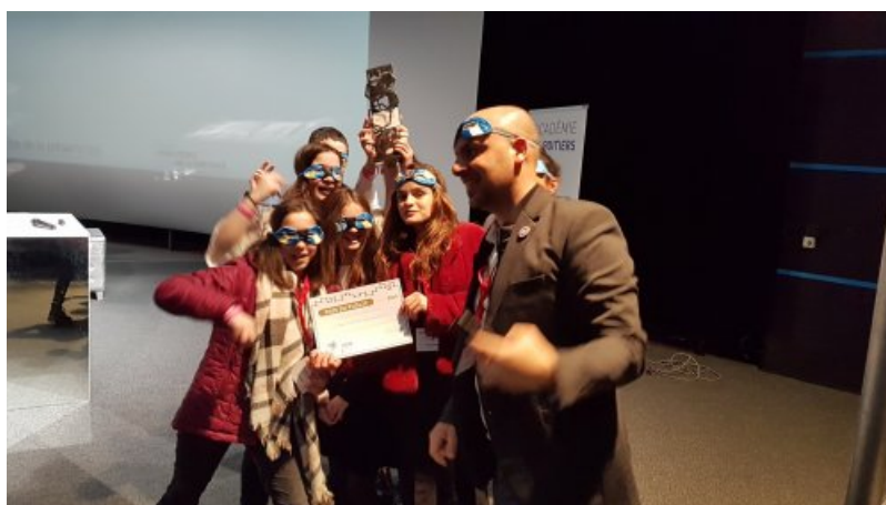
Remise du prix du public

Le collège Maurice Bedel a reçu le prix du Public