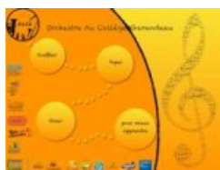
Affiche Orchestre au Collège