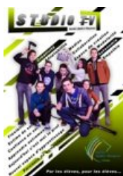
Affiche Aujourd'hui, c'est moi le prof