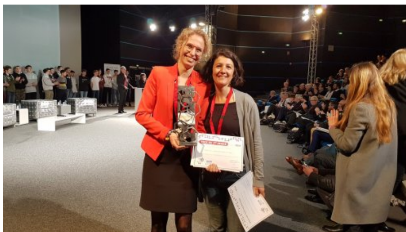
Remise du prix du premier degré