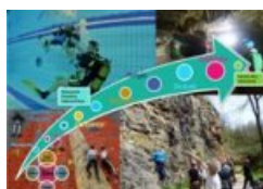
Affiche Estime de soi