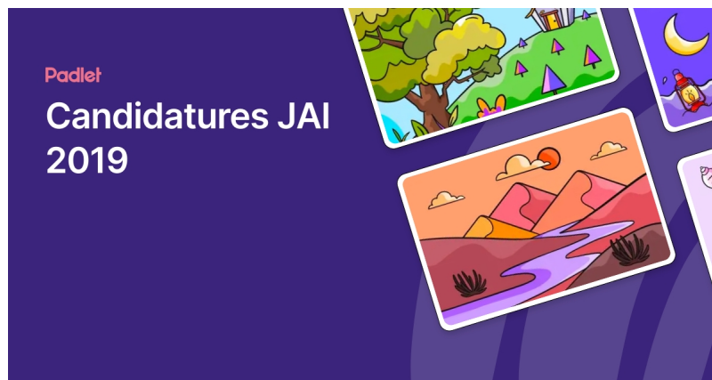
Candidatures JAI 2019 (Padlet)