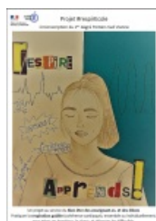
#respire - Circonscription Poitiers Sud Vienne