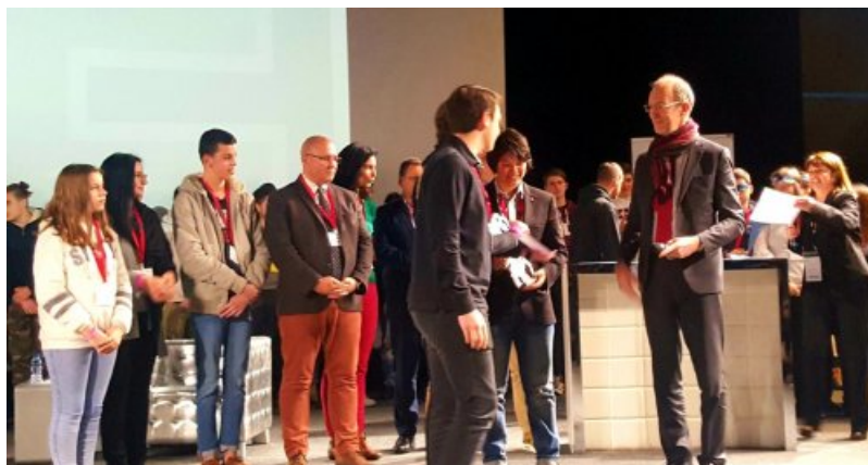
Remise du prix du second degré