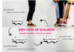
Affiche Bien vivre sa scolarité