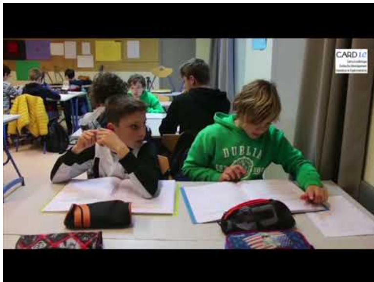
Les classes couleurs au CLG Pierre Loti de Rochefort (Video Youtube)

Chacun trouve sa place, se voit confier des tâches qui lui correspondent et est à même de définir la façon dont il va résoudre les problèmes qu'il rencontre.