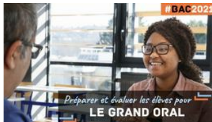
Préparer et évaluer le Grand Oral