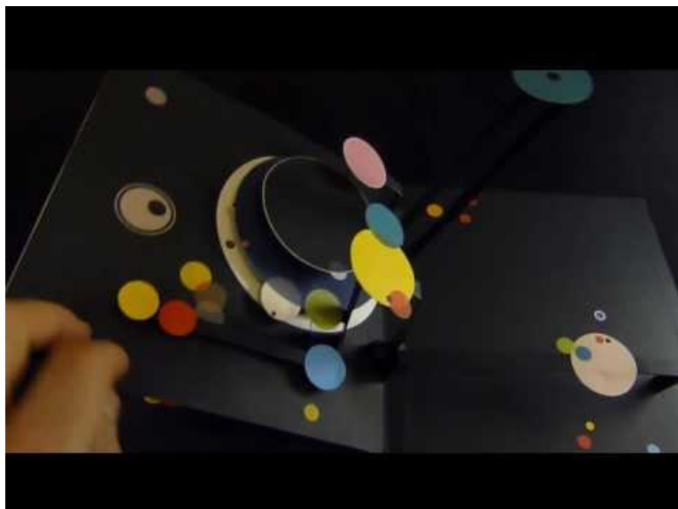
Kandinsky, un pop-up poétique aux éditions Palette (Video Youtube)