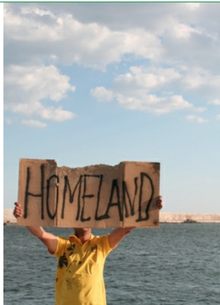
visuel : Lahouari Mohammed Bakir, HOMELAND, 2011, collection FRAC Poitou-Charentes

Du 9 juin au 3 septembre 2017, collections FRAC Poitou-Charentes, FRAC Aquitaine, FRAC-Artothèque du Limousin