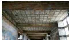
Architecture de paysage dialogue avec les espaces du château d'Oiron

Le déploiement de l'exposition collective Architectures de paysage permet de poursuivre une année de rencontres et d'invitations venant pointer des éléments constitutifs du lieu.