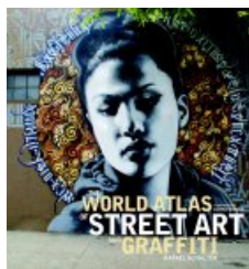
couverture du livre de Rafael Schacter

Beaucoup plus diversifié que le 4 ème mur , le festival En vie urbaine se déroule du 10 au 18 octobre. On retiendra surtout :