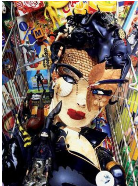
Bernard Pras, Cat Caddy (détail), 2007

Cette année, l'exposition thématique de l'école d'Arts Plastiques de Châtelleraut "Dispositifs", regroupe des artistes dont les recherches plastiques placent le spectateur dans le doute.