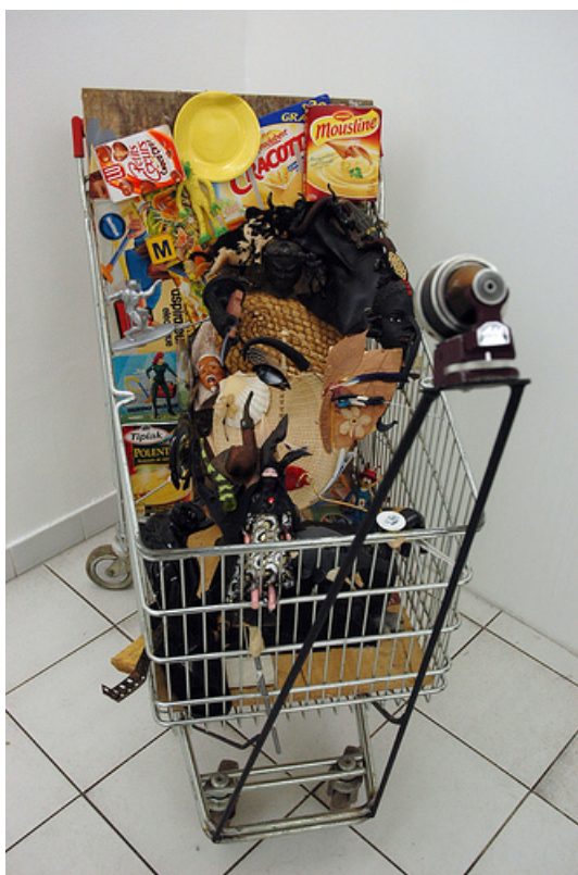
Bernard Pras, Cat caddy 2007 Impression numérique, édition ACAPA. Coll.Artothèque de Châtelleraut.

Né en 1952, Bernard PRAS est diplômé de l'Ecole Supérieure des Beaux-Arts de Toulouse. Après 20 ans de peinture, il conçoit en 1997 une nouvelle forme d'expression, à mi-chemin entre la peinture, la sculpture et l'installation. A partir d'un croquis préparatoire, il collecte des objets totalement hétéroclites, choisis selon leur couleur, leur forme, mais aussi en rapport avec le sujet traité. Vient alors la longue étape de l'assemblage des objets , pouvant lui prendre plusieurs semaines, avec un aller-retour incessant entre l'installation en cours et le viseur de son appareil photographique. Peu à peu l'oeuvre se crée, et l'image en sera figée. Ses tirages photographiques (Cibachrome sous Diasec) sont depuis présentés dans le monde entier, rencontrant toujours un très vif succès.