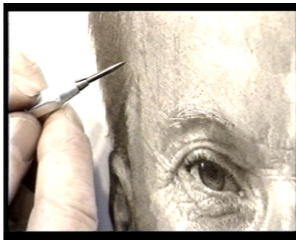
Jean-Olivier Hucleux, Image extrait de « Works & Process (DVD)- Jean Olivier Hucleux » a.p.r.e.s éditions- Works & Process (DVD) , 2011

L'oeuvre de Jean Olivier Hucleux (1923-2012) a été révélée au monde l'art le 30 juin 1972 à Cassel, lors de l'inauguration de la grande exposition « Enquête sur la réalité - Imageries d'aujourd'hui. d5, la documenta 5 ».