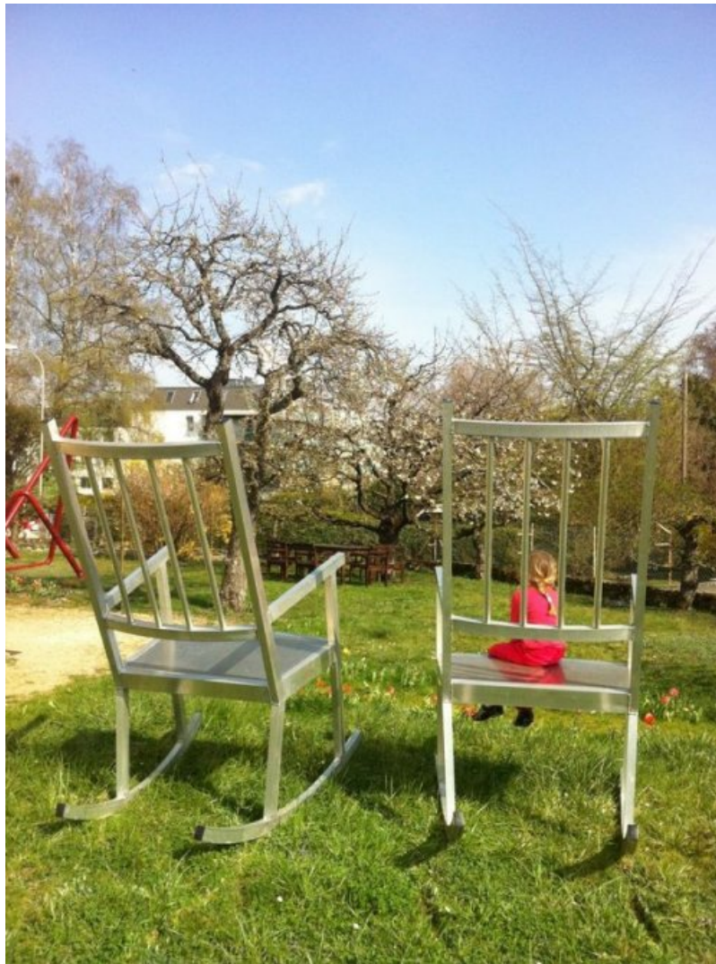
Lilian Bourgeat , « Rocking chairs », 2009 Aluminium – 190 x 104 x 154 cm chacun

Lilian Bourgeat (né en 1970, vit et travaille à Dijon)