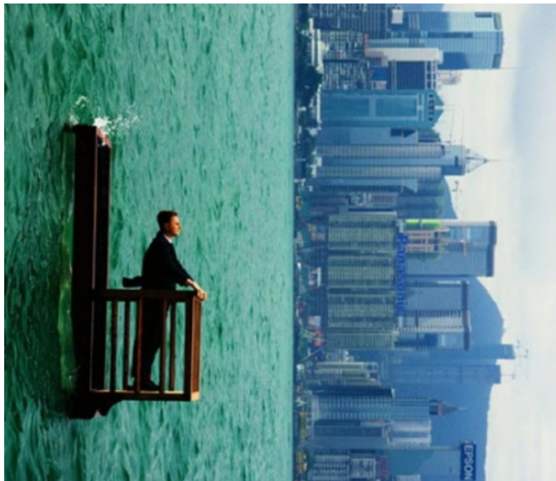
Philippe Ramette, Contemplation irrationnelle, 2003 © Philippe Ramette, Galerie Xippas

Philippe Ramette (né en 1961) aime défier les lois de la gravité et de la logique. Cet artiste sculpteur, photographe et dessinateur est l'auteur d'installations surréalistes qui le mettent en scène dans des postures improbables et illogiques.