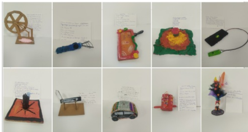
Travaux des élèves

Vous êtes un archéologue de l'an 5682 et vous arrivez sur cette planète abandonnée. En l'explorant, vous trouvez au sol un fragment d'objet. À partir de ce fragment, imaginez et inventez l'histoire et la fonction de cet objet. Puis vous créez et reconstituerez cet objet avant de lui fabriquer un cartel complet.