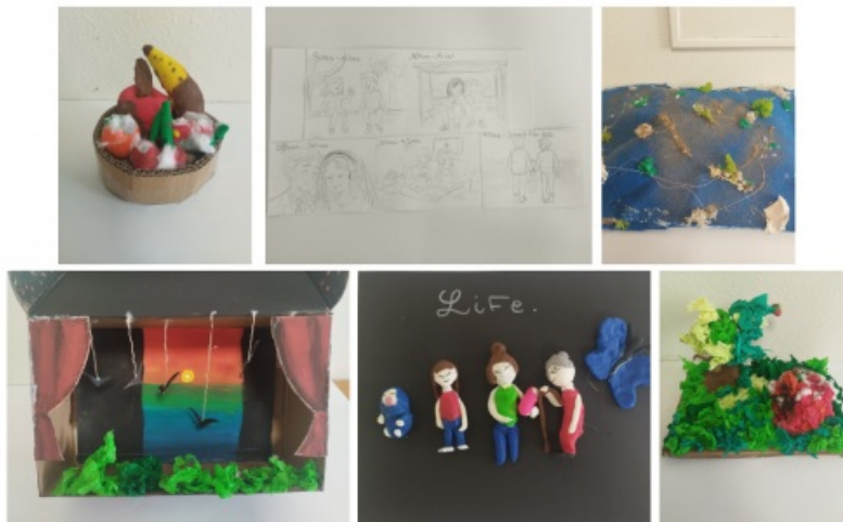
Productions des élèves de CHAAP autour des thèmes de l'exposition L'automne des idées 2

Les élèves de 5CHAAP, 4CHAAP et 3CHAAP ont travaillé autour des thématiques et démarches artistiques proposées dans l'exposition l'Automne des idées du Frac Poitou-Charentes .