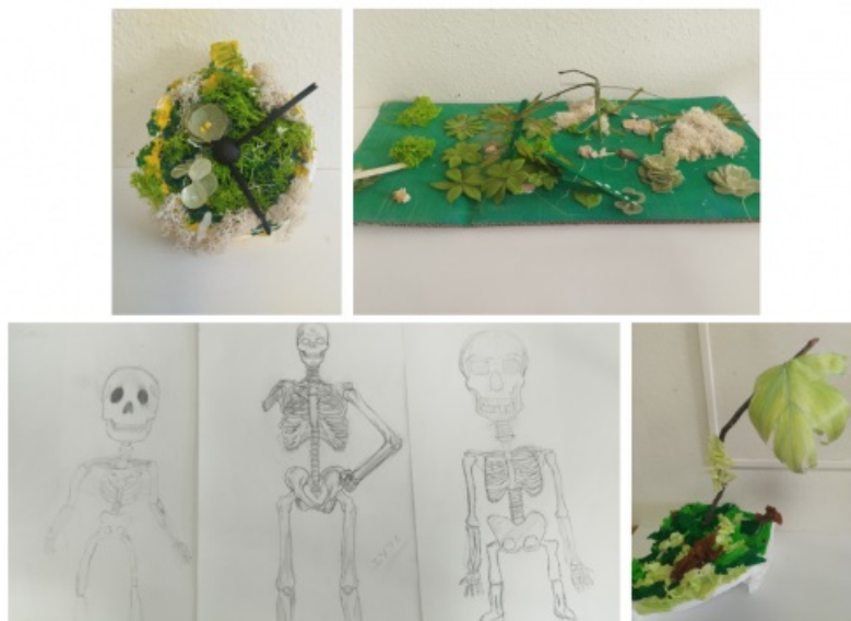
Productions des élèves de CHAAP autour des thèmes de l'exposition L'automne des idées 1

Nous avons ensuite été visiter l'exposition au FRAC avec les différentes classes. Les 5CHAAP avec moi et les 4CHAAP et 3CHAAP de leur côté ont pu être répartis en petits groupes de 5-6 élèves et ont réalisé la visite avec les étudiants de l'EESI.