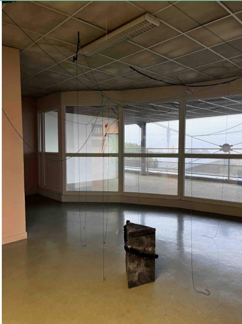
Espèce d'espace : proposition de Sacha