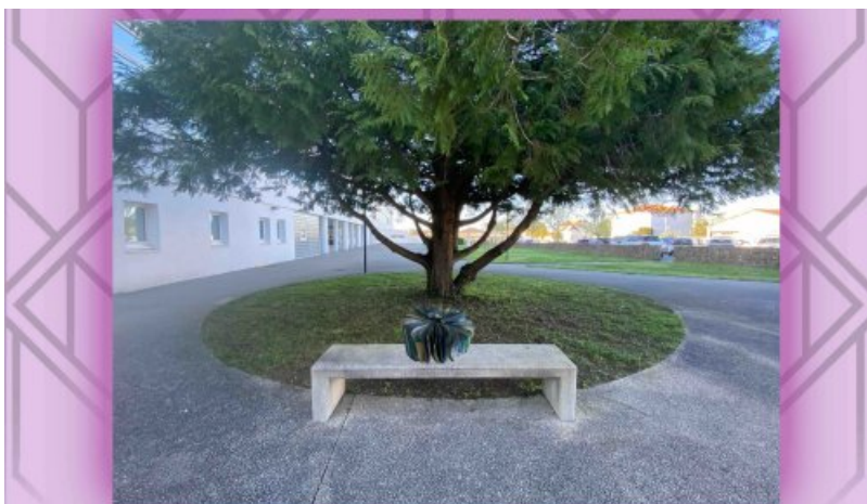
Ce lieu se situe à l'entrée du lycée, en face du self. On y voit un arbre au centre, entouré d'un cercle d'herbe avec un banc en béton placé devant. Le tout est entouré d'un chemin en béton. À gauche, un bâtiment blanc avec des fenêtres, le lycée.