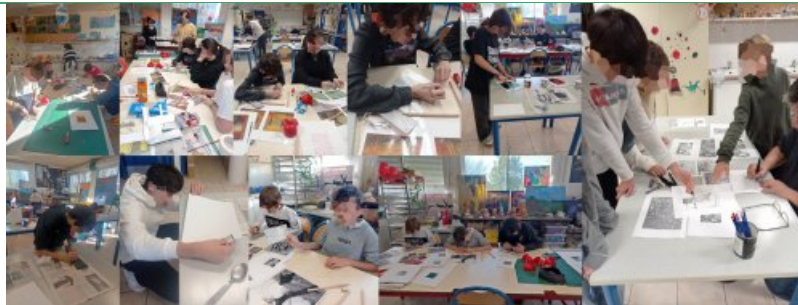
Atelier de remédiation par les Arts, Collège Léopold Dussaigne, Jonzac - Atelier