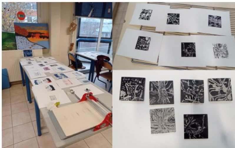
Atelier de remédiation par les Arts, Collège Léopold Dussaigne, Jonzac - Les gravures