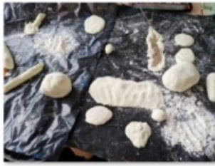
coulage et moulage (1)