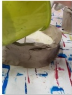
coulage et moulage (3)