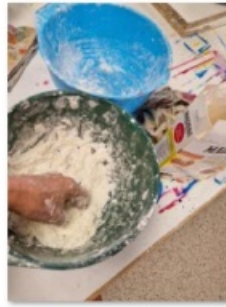
coulage et moulage (2)