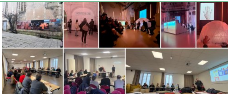
Habiter le mouvement - Photos