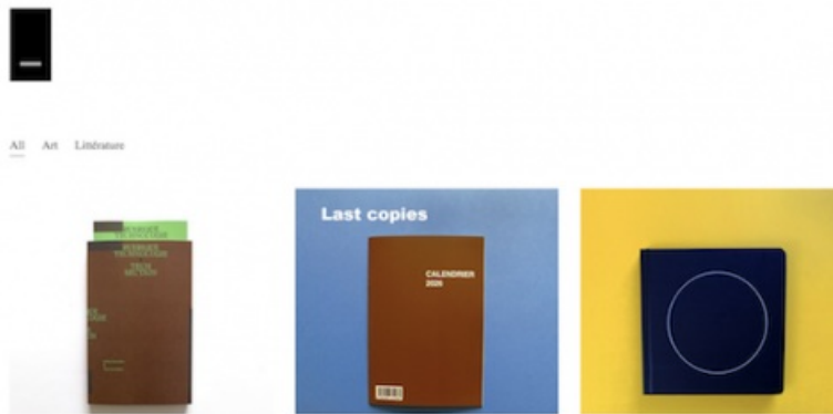
RRose éditions - page d'accueil

RRose éditions ↗ est une maison d'édition associative fondée en 2014 par Tarek Issaoui et installée depuis quelques années à La Rochelle ; RRose est spécialisée dans l'édition de livres d'artistes contemporains mettant en jeu des processus de création conceptuels ou digitaux. Cette belle maison publie entre autres des roman de Gregory Chatonsky ↗ , des listes poétiques de Claude Closky ↗ , des programmes génératifs de Jean-Noël Lafargue ↗ ou des livres d'images de Corinne Vionnet ↗ .