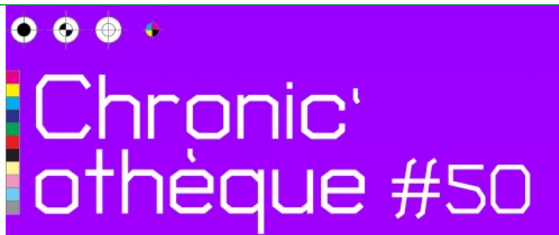
Chronic'othèque #50 - Octobre 2025 (PDF de 856.4 ko)

Regards choisis sur des livres, des podcasts, des vidéos, focus sur une exposition. Novembre 2025