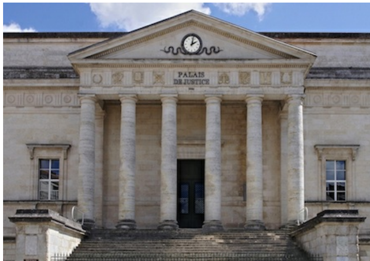
Palais de justice d'Angoulême

Dans le cadre du Festival International de la Bande Dessinée d'Angoulême 2026 , le tribunal judiciaire et le parquet d'Angoulême, en partenariat avec la cité internationale de la bande dessinée et de l'image et la direction des services départementaux de l'Éducation nationale, organise la deuxième édition du concours intitulé « Dessine-moi ta justice ».