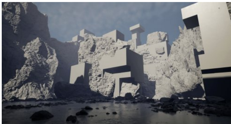
David Legrand, extrait d'un paysage immersif du programme numérique « Transmutation d'une collection »

NB. Un courriel sera envoyé à votre autorité hiérarchique pour demander une validation de votre candidature.