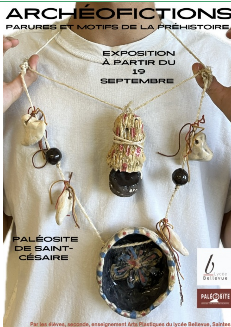
Archéofictions – Parures et motifs de la préhistoire

Une exposition de productions plastiques d'élèves en classe de seconde arts plastiques au Paléosite de Saint-Césaire (17)