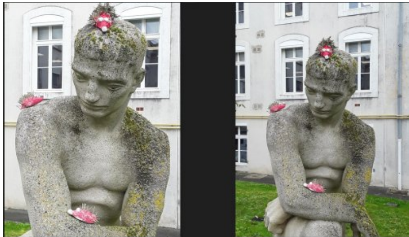
Hérissons installés sur une sculpture dans la cour d'honneur du collège. Argile, épines de pin, peinture rose.