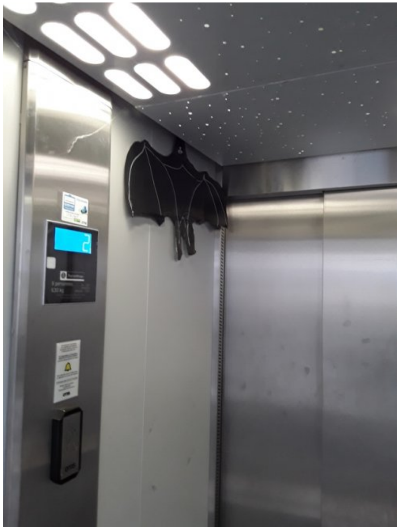
Chauve souris dans l'ascenseur, sac poubelle noir, Posca blanc et fil de fer.