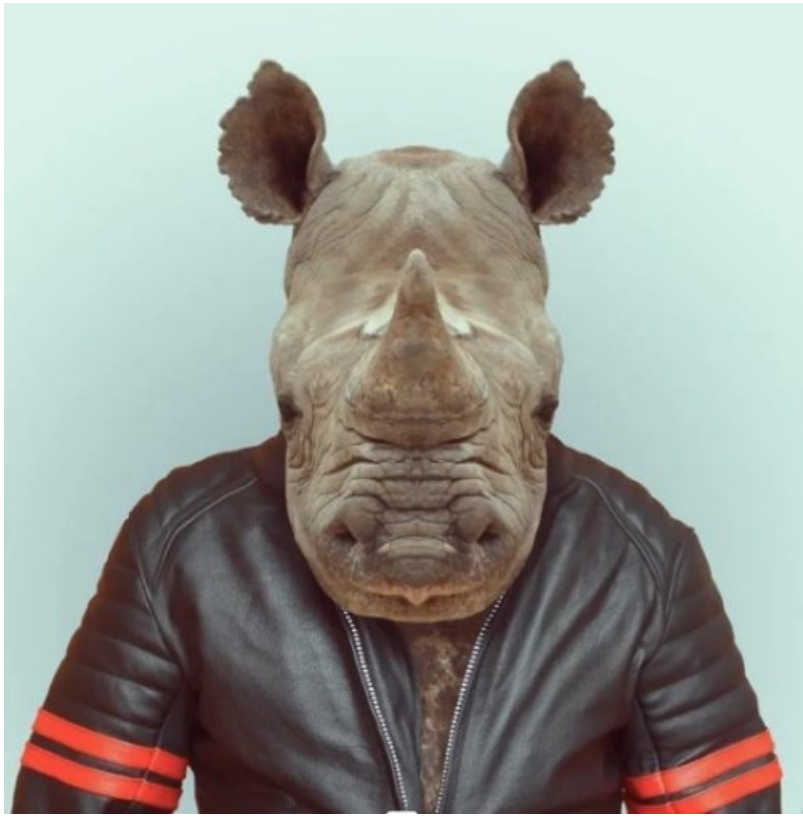
Série "Zoo Portraits", Yago Portal humanise des animaux en les photographiant habillés dans des tenues humaines. Chaque portrait présente un animal avec une personnalité distincte, exprimée à travers des vêtements qui complètent leur apparence naturelle.