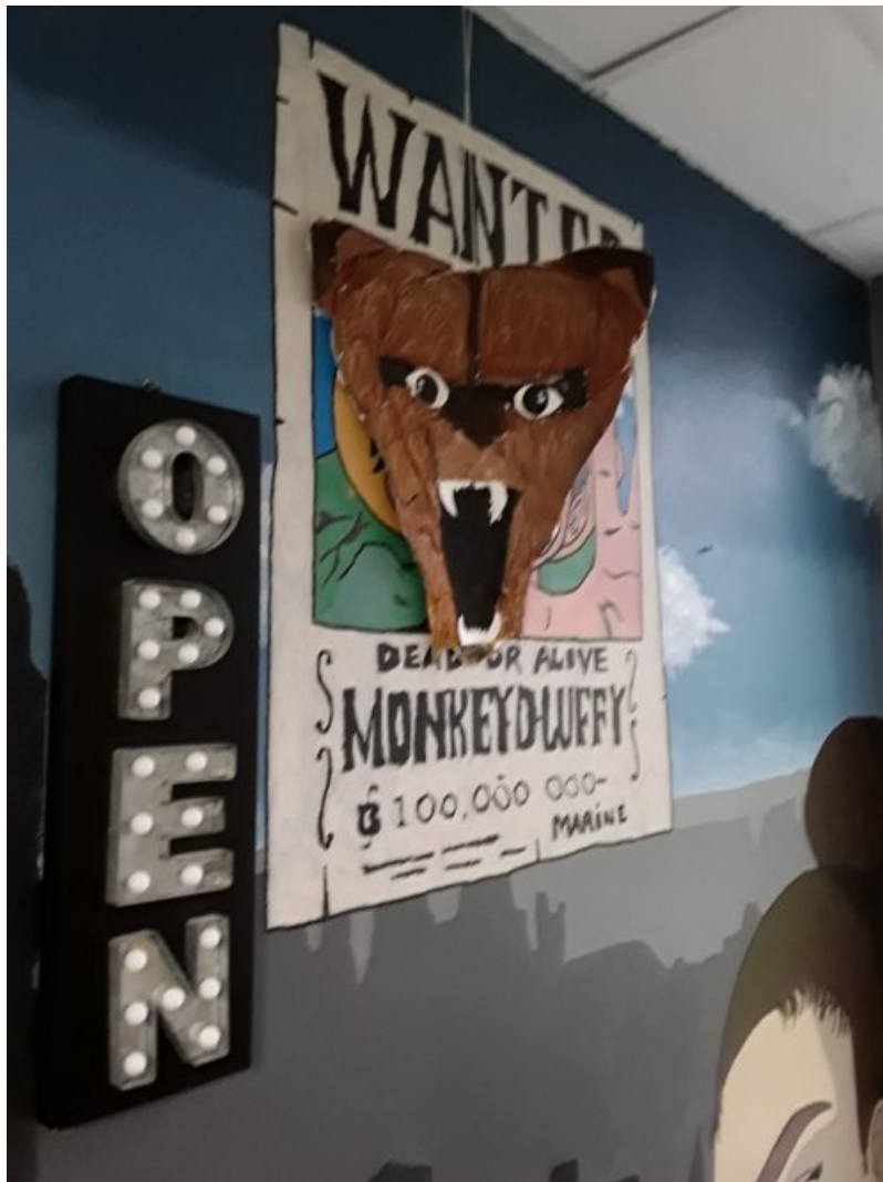
Installée sur une affiche dans le foyer du collège, Collage de cartons, peinture.

Après l'installation, à eux de faire des prises de vue qui mettent en évidence la relation de l'animal avec le lieu. Une fiche pour expliquer la démarche et les intentions est à rendre à la fin de l'heure.