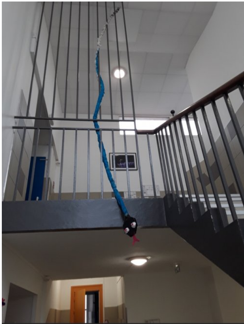
Serpent enroulé sur la grille de la cage d'escalier, papier mâché, carton, fil de fer, peinture.