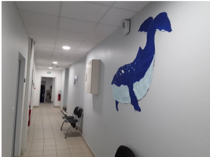
Baleine bleue dans le couloir de l'administration, grand format peinture, pastel.