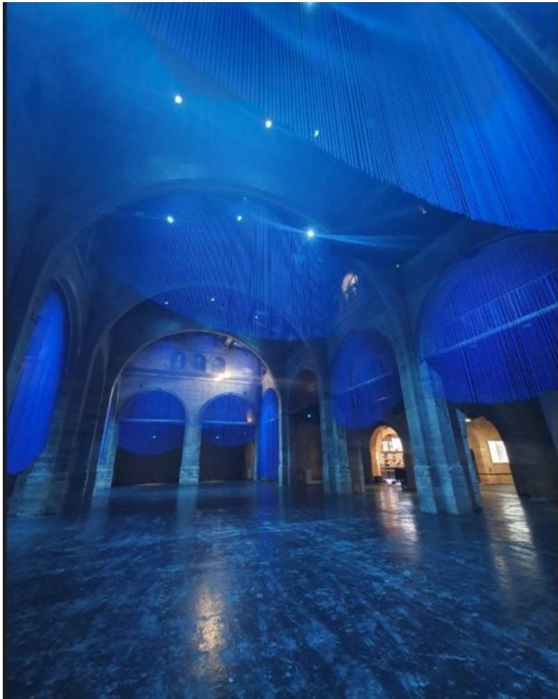
Installation de Kapwani Kiwanga au CAPC de Bordeaux, intitulée "Retenue", œuvre immersive et monumentale occupant la grande Nef du musée. Elle se compose de milliers de cordes teintées en bleu indigo, suspendues dans l'espace, créant des formes évoquant des voiles ou des rajouts de cheveux géants. Ces cordes, au total 53 km, rappellent l'indigo importé des Antilles pendant la période coloniale. L'eau joue également un rôle crucial dans cette installation. Deux rideaux de cordes laissent ruisseler l'eau, évoquant les marées de la Garonne qui